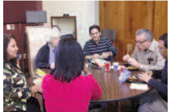
Junta durante pasada reunión en Elkhart.