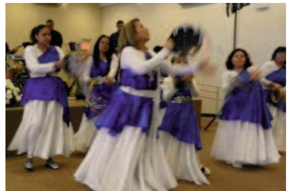
Danza de celebración