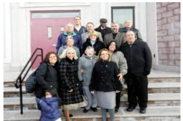
Delegación de CFM

aunque todavía faltan algunos asuntos importantes, como es el permiso de ocupación del sótano hasta que el elevador esté terminado, lo que interesaba ahora, era celebrar los cultos en las nuevas facilidades. Tal así, “que el siguiente domingo 14 de diciembre, tuvimos un servicio de