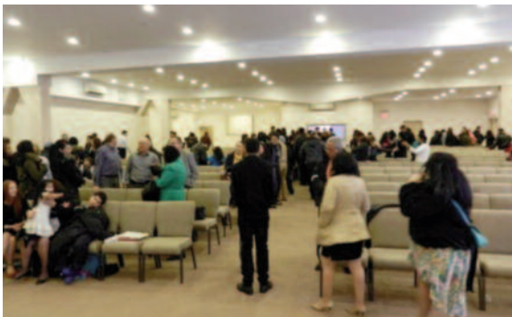
Interior del templo