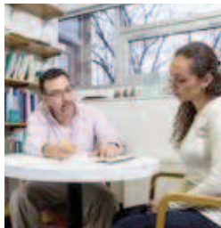
Profesor y estudiante en diálogo, en Goshen College

- “no estoy seguro(a) de lo que quiero hacer para mi futuro”